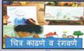
चित्र काढणे व रंगवणे