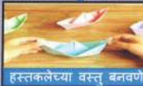
हस्तकलेच्या वस्तू बनवणे