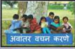
अवांतर वचन करणे